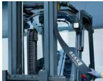
Sätt på trucken/masten då de inte används