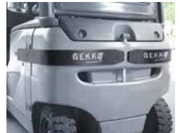
Även användbar som stötskydd på truckchassit