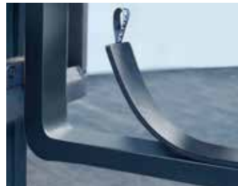
Med handtag för lätt av- och påtagning